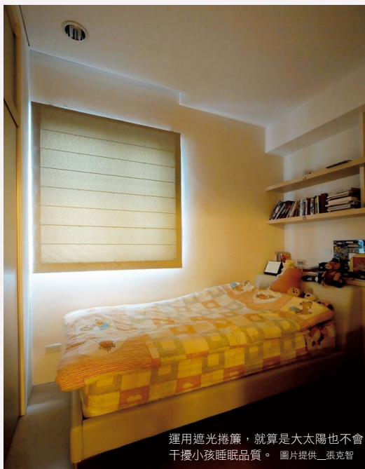
運用遮光捲簾，就算是大太陽也不會干擾小孩睡眠品質。